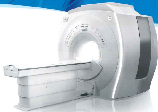
GE SIGNA Creator1.5T (当検査使用 最新 MR 装置)